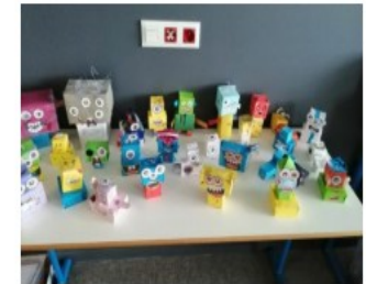
Les monstres des sixièmes

Bienvenue sur le nouveau site du collège