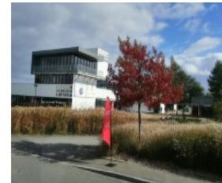
Sortie fête de la science octobre 19 Ploufragan