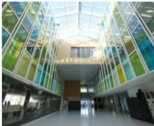
Le collège en photos

TOUTATICE DISPOSITIFS, PROJETS ET ACTIONS ▾ CLUBS ET ASSOCIATIONS ▾ DISCIPLINES ▾ CDI CALENDRIER