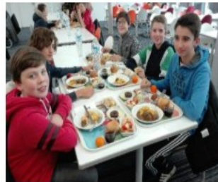
Repas de Noël